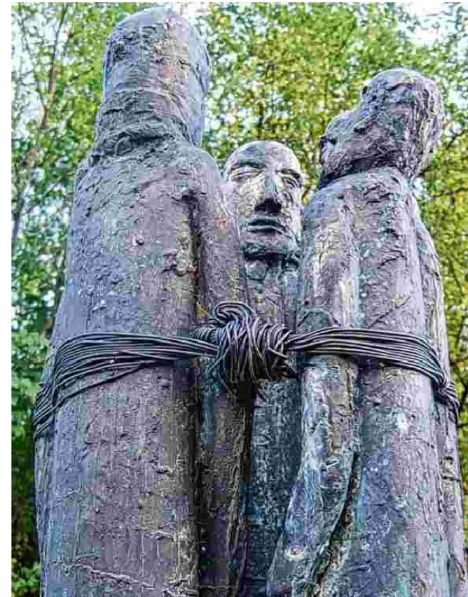
Mahmal bei der Erinnerungsstätte an die NS-Lager an der Moosach in St. Pantaleon wurde von Bildhauer Dieter Schmidt aus Fridolfing gestaltet. (OÖN-fisc)